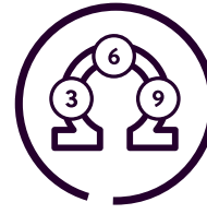
Rich in omega 3, 6 & 9